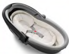
Автокресло «люлька» группы 0

Детские удерживающие устройства подразделяют на 5 весовых групп: