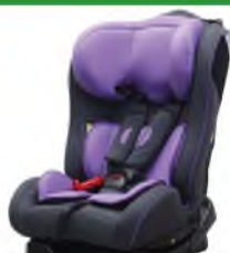
Автокресло группы II