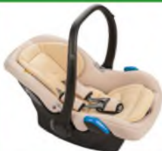
Автокресло группы 0+