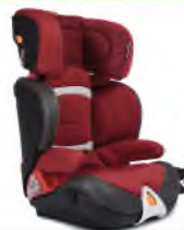
Автокресло группы III

для детей массой 22-36 кг (возможно использование бустера)