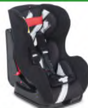
Автокресло группы I