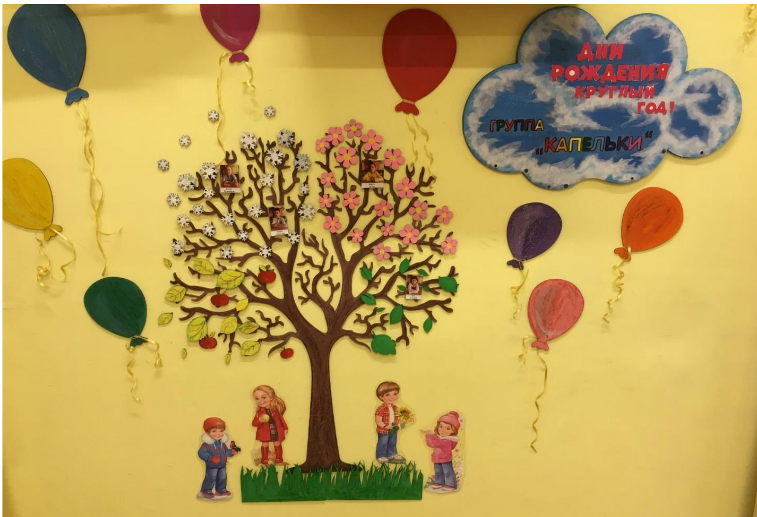
Уголок «Дни рождения круглый год»