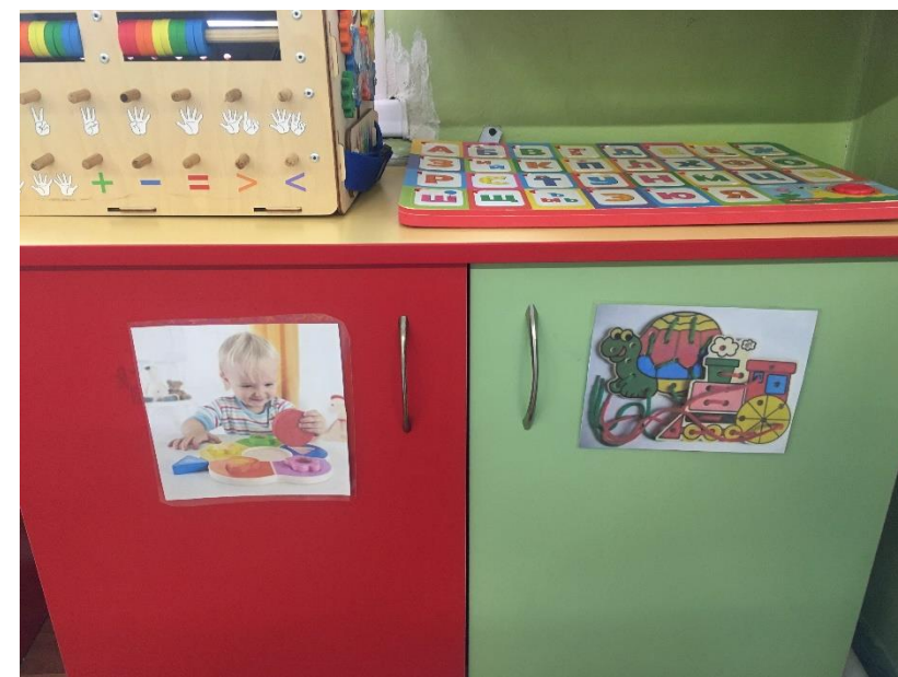
«Визуальные картинки игр»