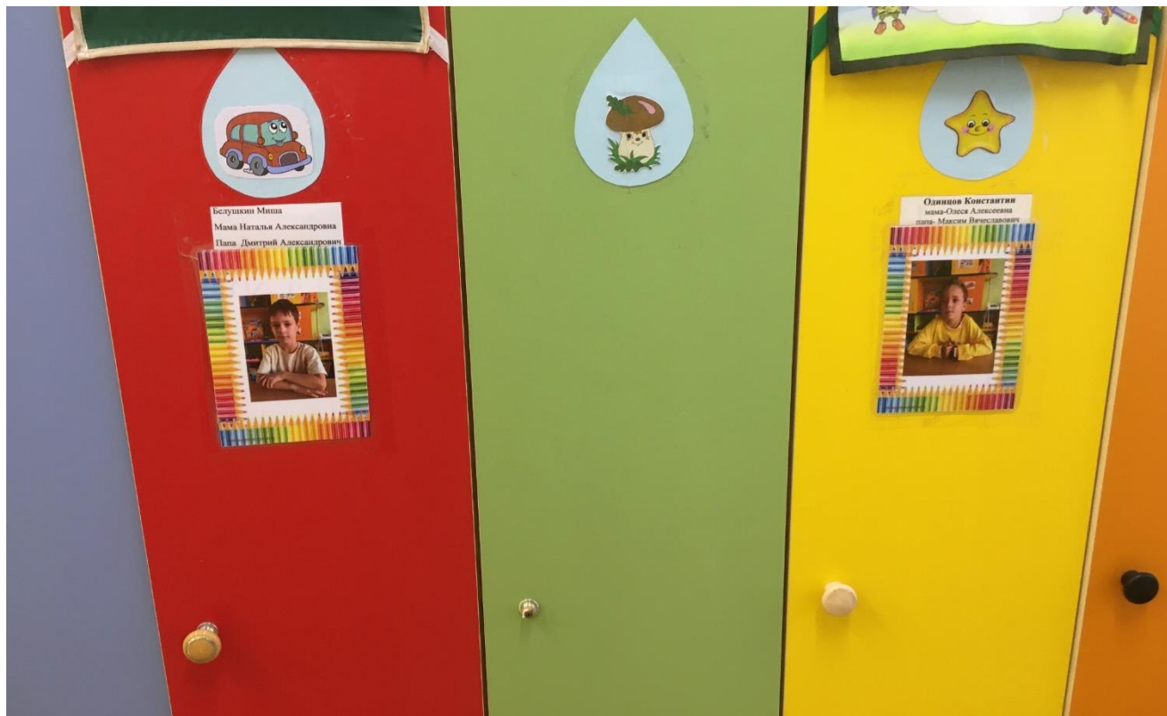
Индивидуальные шкафчики для каждого ребенка