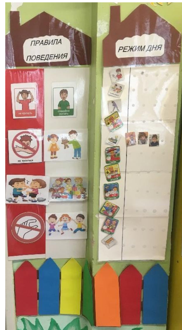
Уголок «Правила группы»