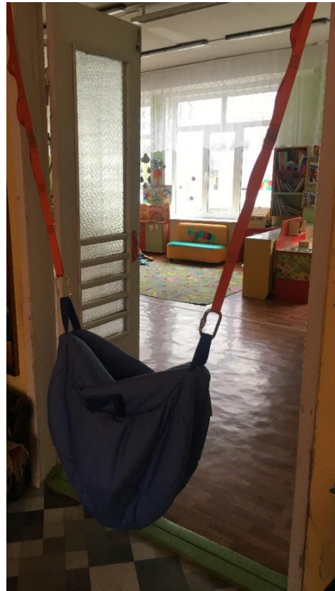
Кокон «Няня Сова»