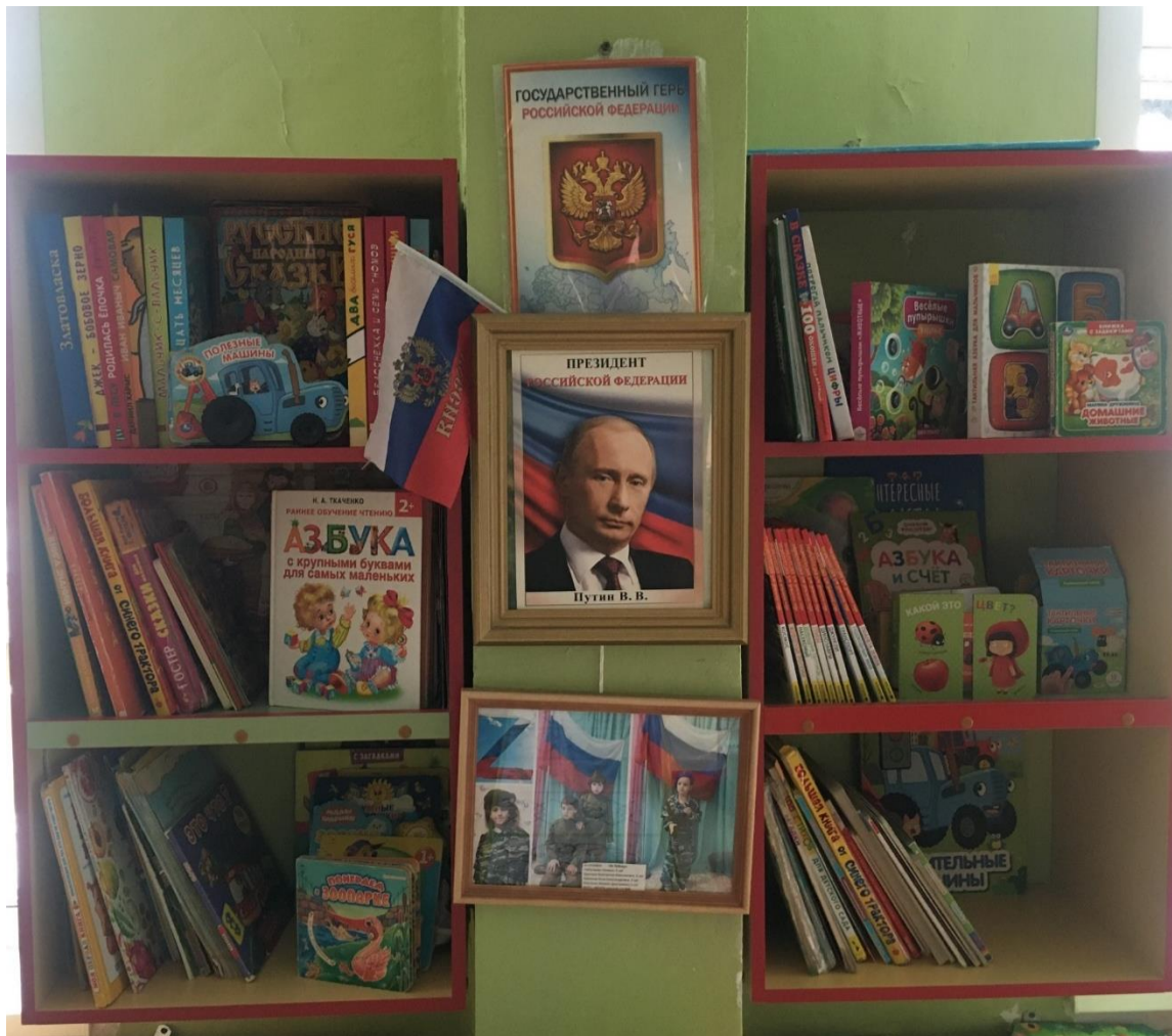
Книжный и патриотический уголок