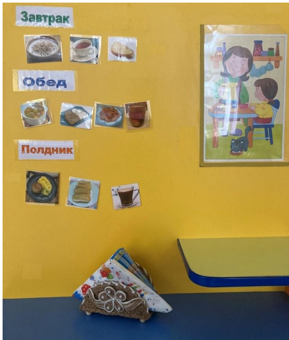
Уголок «Говорящее меню»